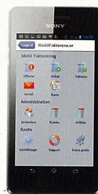
Combains system laddas ner som en app och funkar för android, iPhone och iPad.