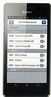
Med en digital lösning som Combains har du alltid koll på både små och stora jobb.